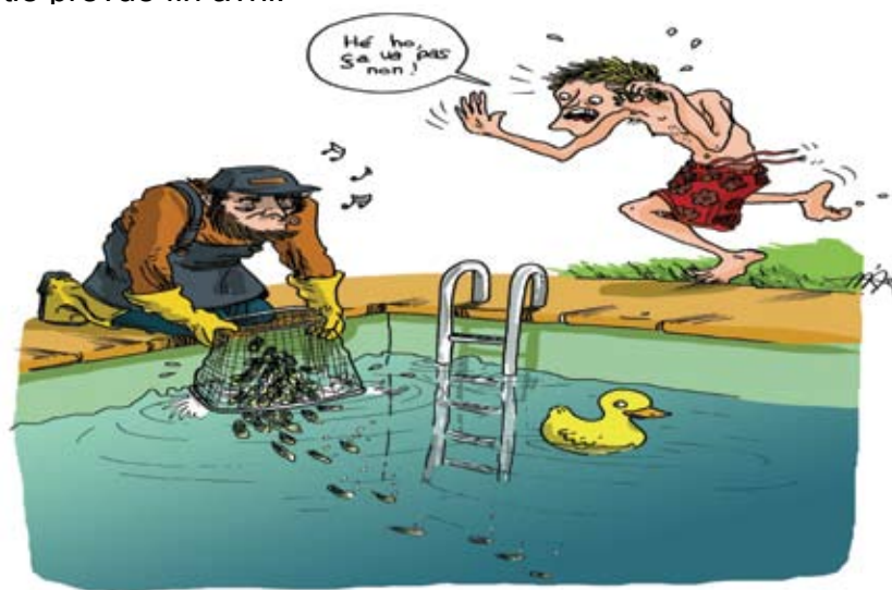
Illustrations humoristiques de Marion Duclos (dessinatrice bordelaise)