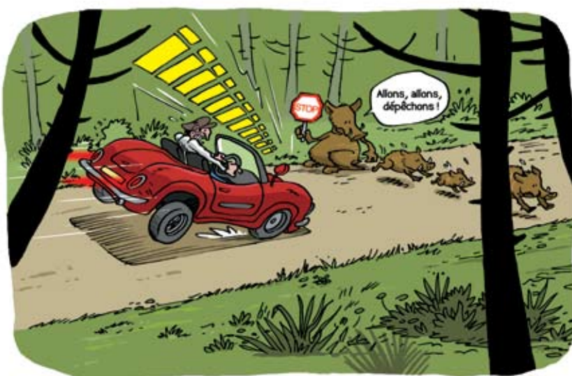
Illustrations humoristiques de BAST (dessinateur bordelais)

32 pages couleurs format A5 Illustrations humoristiques de BAST (dessinateur Bordelais) 70 dessins et photos Reliure cousue, dos carré collé Pelliculage mat 9 €